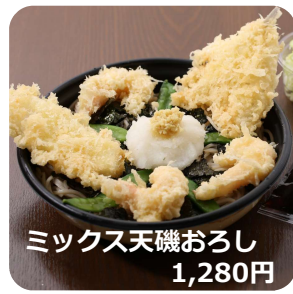
ミックス天磯おろし 1,280円