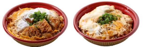
ミニかつ丼 700円 ミニ親子丼 700円